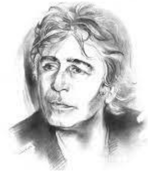
رثاء الأبرياء لوليم شكسبير

اعتمد المترجم توفيق علي منصور بحر الرمل وقافية الهمزة في نقل النص الشعري، لكنه مزج تفعيلات بحر الرمل بتفعيلات بحور أخرى فجاءت أبيات كثيرة غير موزونة. وأدناه القصيدة كما وردت في الكتاب: