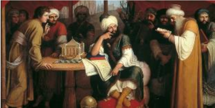
من مظاهر الحركة العلمية في العصر العباسي .. العصر الذهبي للإسلام

ويبدو أنّ المقدسي كان يرى بغداد اليوم من خلال البؤرة المسحورة وهو يقول عنها "وهي في كل يوم الى ورا، واخشى ان تعود كسامرا، مع كثرة الفساد، والجهل والفسق، وجور السلطان" (5)